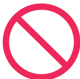
Máximo de personas permitido por la autoridad