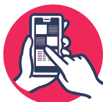
Menú en pizarrón o QR