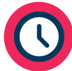
Respetar el horario de cierre determinado por las autoridades