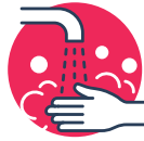
Lavado de manos antes y después de comer