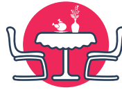
Respetar el número de comensales por mesa, determinado por las autoridades