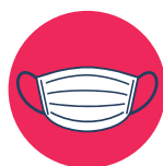
Uso de cubrebocas obligatorio