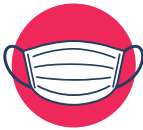
Uso de cubrebocas para ingresar y portarlo adecuadamente siempre que te levantes de la mesa