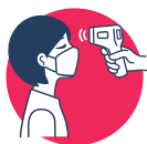
Pasar por el filtro sanitario con toma de temperatura