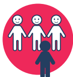
Capacitación a empleados